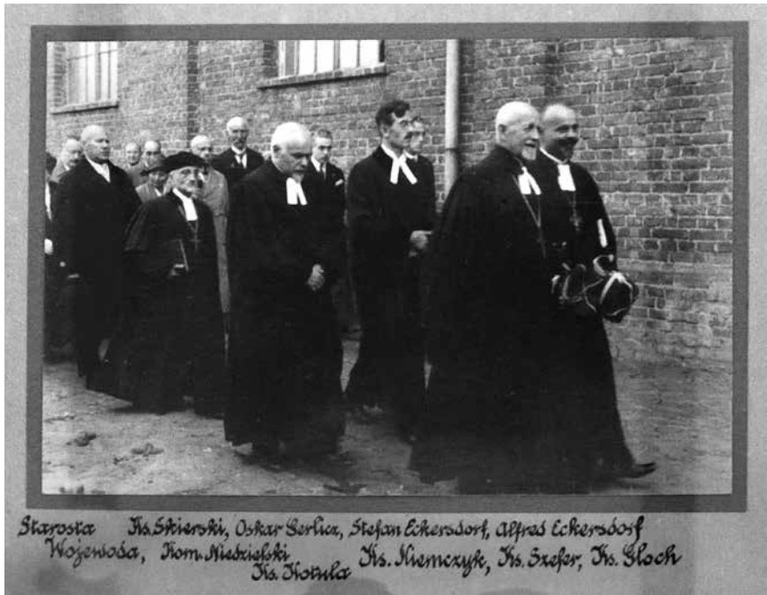
Poświęcenie kościoła ewangelicko-reformowanego w Łodzi w 1932 r. (ze zbiorów parafii ewangelicko-reformowanej w Łodzi)